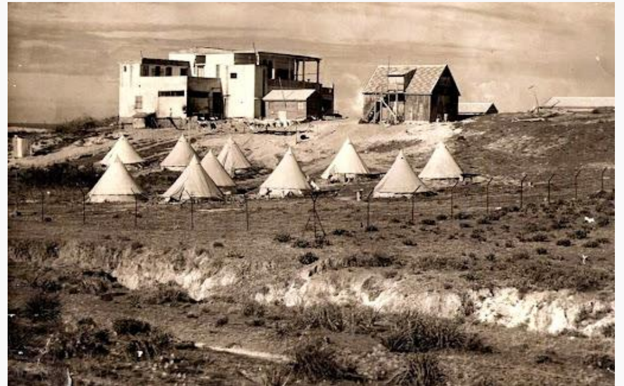
ניצנים בימיה הראשונים