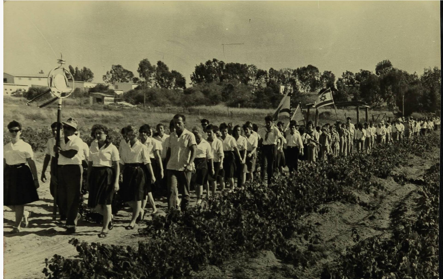
אזכרה לנופלי ניצנים – טור צועד מכפר הנוער לבית העלמין.