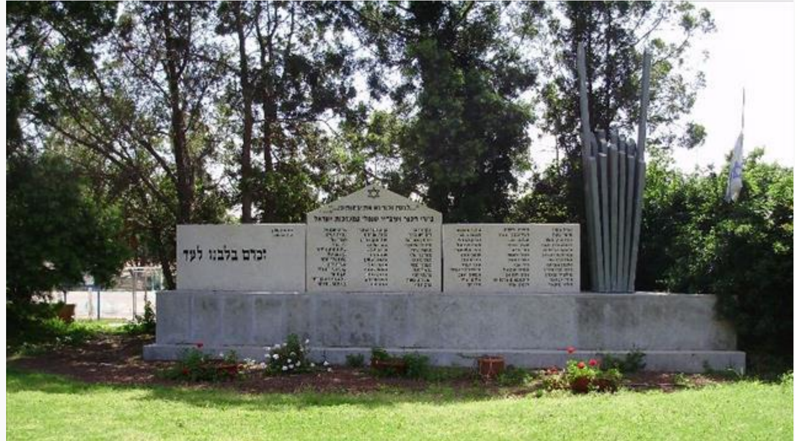
אנדרטה לבוגרי כפר הנוער על שם מוסינזון ועובדיו שנפלו במערכות ישראל, הוד השרון