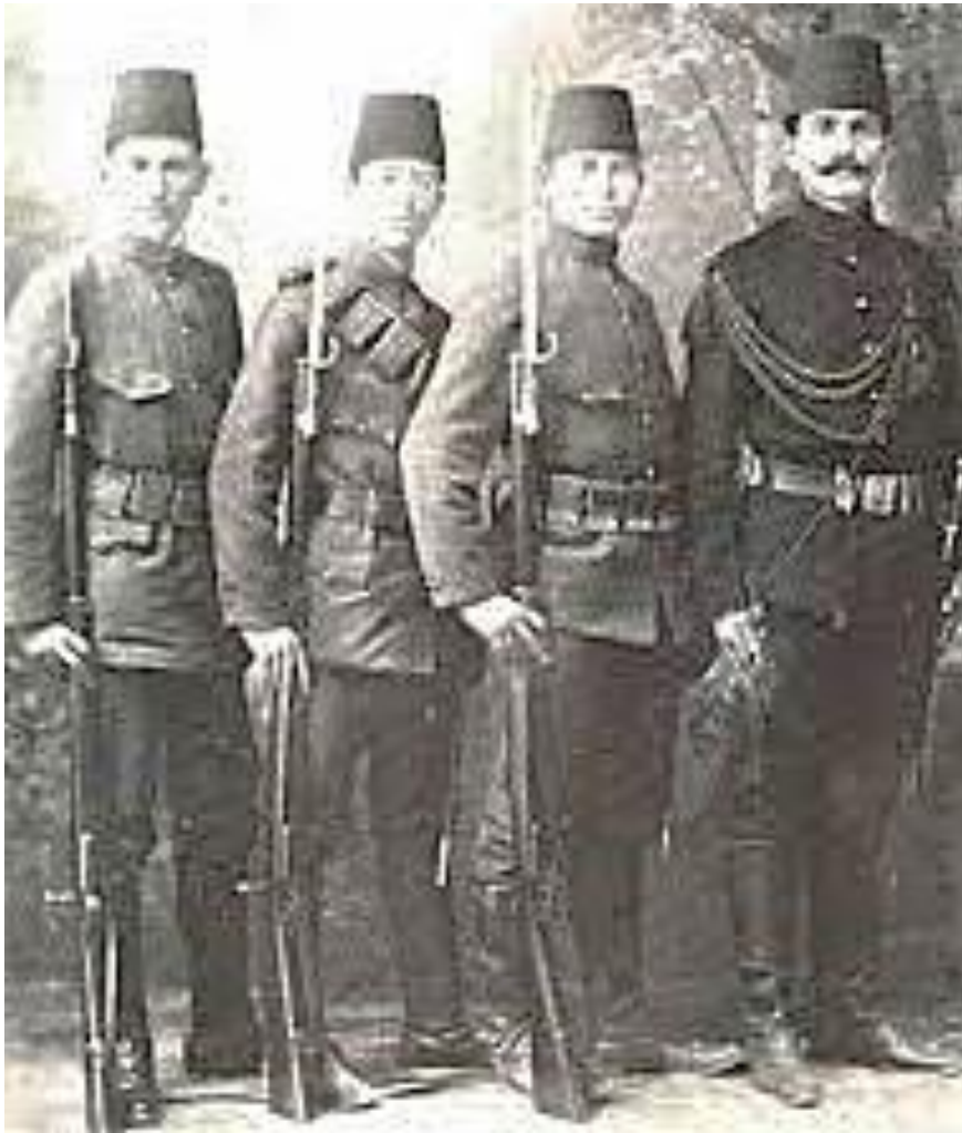
חילים יהודיים בצבא התורכי בירושלים (1915) מקור: בני לים 2018

https://www.facebook.com/groups/JRSMemories/posts/539738666452433/?_rdr